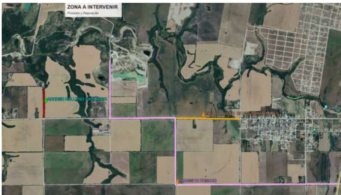
Imagen 3: Ubicación de la zona II Relleno Sanitario, Tránsito Pesado Calle Alvear a intervenir

NICOLAS AVELLANEDA 1525 - ALDEA BRASILEIRA - ENTRE RIOS TELÉFONO: 0343-4853735 MAIL: MUNICIPALIDAD_ALDEABRASILEIRA@HOTMAIL.COM