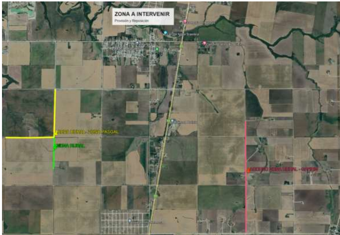
Imagen 4: Ubicación de la zona III Rural

NICOLAS AVELLANEDA 1525 - ALDEA BRASILEIRA - ENTRE RIOS TELÉFONO: 0343-4853735 MAIL: MUNICIPALIDAD_ALDEABRASILEIRA@HOTMAIL.COM