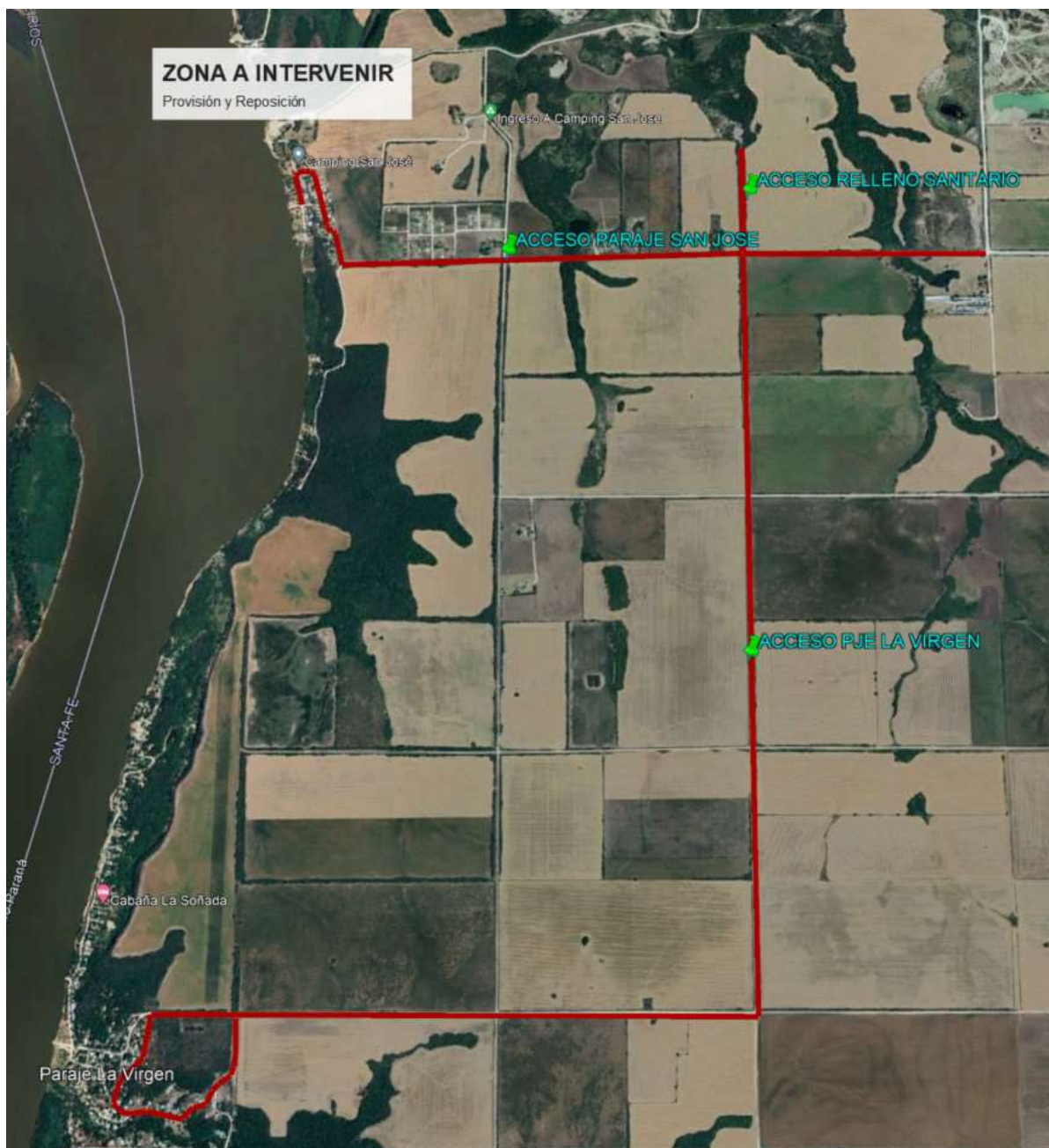
Imagen 2: Ubicación de la zona I: Paraje San José y Paraje La Virgen

NICOLAS AVELLANEDA 1525 - ALDEA BRASILEIRA - ENTRE RIOS TELÉFONO: 0343-4853735 MAIL: MUNICIPALIDAD_ALDEABRASILEIRA@HOTMAIL.COM